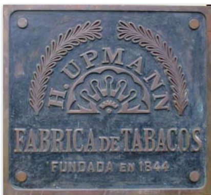
Das Messingschild hat die unterschiedlichen Stationen der Marke stets begleitet und hängt heute am Zaun neben dem Eingang zur Manufaktur.

und der 16. Straße. Langt man dort an, fällt die Manufaktur sofort ins Auge, da sie erst vor wenigen Jahren komplett neu renoviert worden ist. In einem strahlenden Gelb leuchtet sie dem Betrachter entgegen. Besonders beeindruckend ist dieser Anblick bei blauem, wolkenlosem Himmel.