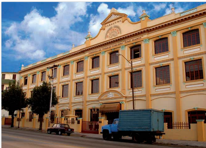
H.Upmann – Fabrica José Martí. So lautet heute der offizielle Name der Manufaktur

Im Jahr 2003 verlegte man die Produktion der Marke H.Upmann von der Calle Amistad offiziell in die Räumlichkeiten einer Manufaktur, die in der Geschichte der Cigarrenindustrie schon eine große Rolle spielte. Die Rede ist von der Manufaktur auf der Calle 23 in Havannas Stadtteil Vedado, die heute den Namen „Fabrica José Martí“ trägt. Erbaut wurde das Gebäude wahrscheinlich im Jahr 1927, folgt man den Angaben am Giebel des Hauses.