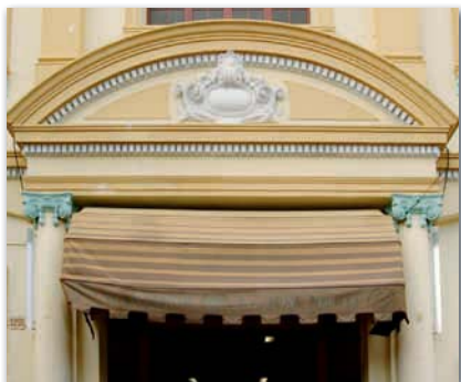
Auf der Markise über dem Eingang der Manufaktur ist der Name derselben zu lesen.

Am einfachsten findet man die Manufaktur, wenn man die Suche vom berühmten Hotel „Nacional“ aus startet. Die Straße, die links neben dem beeindruckenden Gebäude des „Nacional“ vom Malecon, der breiten Uferstraße, aus im rechten Winkel links nach oben führt, ist die Calle Rampa. Diese heißt in der Verlängerung Calle 23, da in den neueren Stadtteilen Havannas die Straßen keine Namen, sondern stattdessen Nummern tragen. Nun muss man nur noch auf die Seitenstraßen achten, die ebenfalls nummeriert sind. Die Manufaktur befindet sich auf der Calle 23, zwischen der 14.